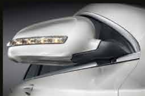
НАРУЖНЫЕ ЗЕРКАЛА С ОБОГРЕВОМ И ЭЛЕКТРОПРИВОДОМ СКЛАДЫВАНИЯ