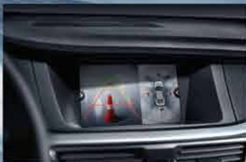
КАМЕРА ЗАДНЕГО ВИДА С ДИНАМИЧЕСКОЙ РАЗМЕТКОЙ