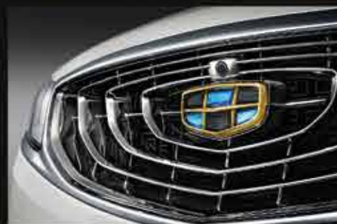
ЭФФЕКТНАЯ РЕШЕТКА РАДИАТОРА