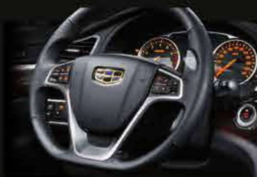
МУЛЬТИФУНКЦИОНАЛЬНОЕ РУЛЕВОЕ КОЛЕСО С КОЖАНОЙ ОТДЕЛКОЙ