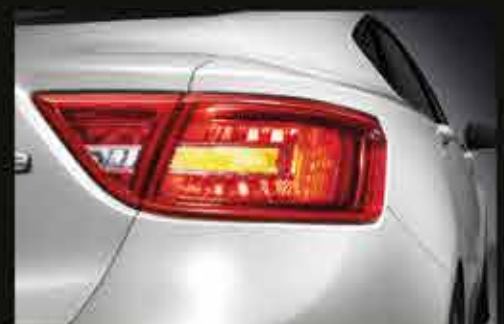
ЗАДНИЕ LED ФОНАРИ