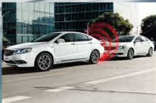
ПЕРЕДНИЕ И ЗАДНИЕ ДАТЧИКИ ПАРКОВКИ

Многочисленные инновационные решения, использованные в автомобиле Geely Emgrand GT отражают высокий технологический прорыв марки Geely: система мониторинга слепых зон, автоматическая парковка, круиз-контроль, камера заднего вида с динамической разметкой, передние и задние датчики парковки, система помощи при экстренном торможении.