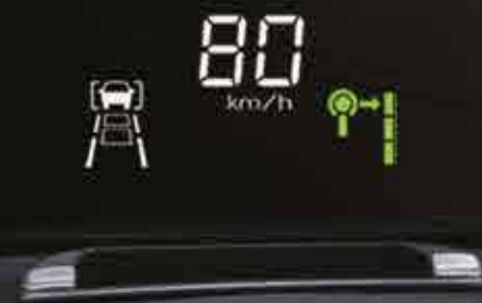
ПРОЕКЦИЯ НА ВЕТРОВОЕ СТЕКЛО