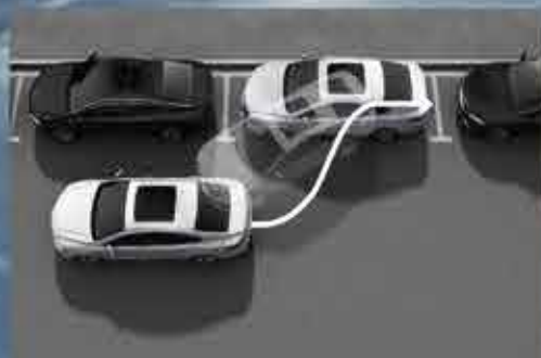
СИСТЕМА АВТОМАТИЧЕСКОЙ ПАРКОВКИ