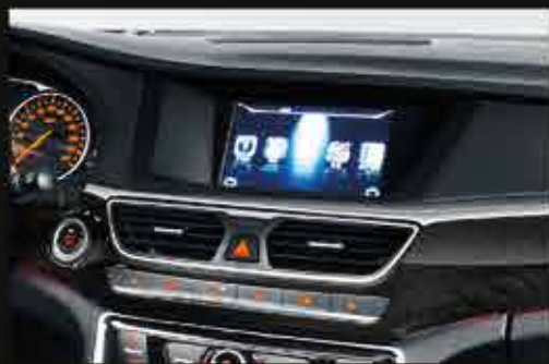
МУЛЬТИМЕДИЙНАЯ СИСТЕМА С 8" ДЮЙМОВЫМ ЭКРАНОМ