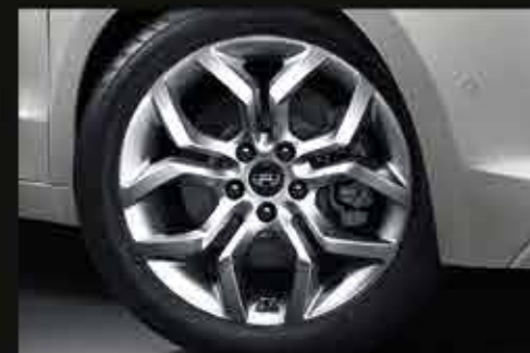
18" ДЮЙМОВЫЕ ЛЕГКОСПЛАВНЫЕ ДИСКИ