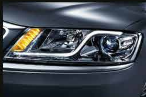
СТИЛЬНЫЕ ГАЛОГЕНОВЫЕ ФАРЫ ГОЛОВНОГО СВЕТА