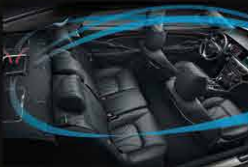
СИСТЕМА КОНТРОЛЯ КАЧЕСТВА ВОЗДУХА В САЛОНЕ