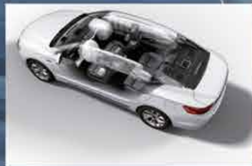
7 ПОДУШЕК БЕЗОПАСНОСТИ