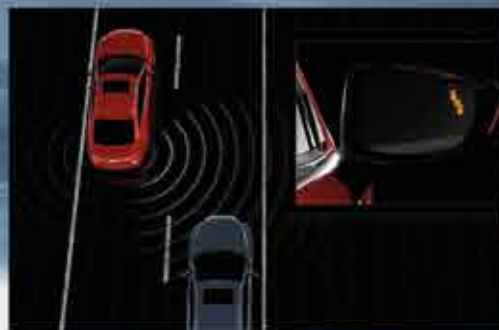
СИСТЕМА МОНИТОРИНГА СЛЕПЫХ ЗОН