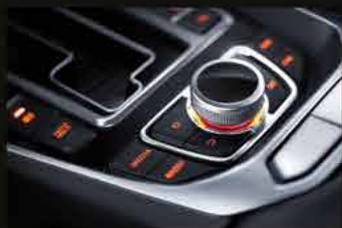
ЭЛЕМЕНТЫ УПРАВЛЕНИЯ МУЛЬТИМЕДИЙНОЙ СИСТЕМОЙ