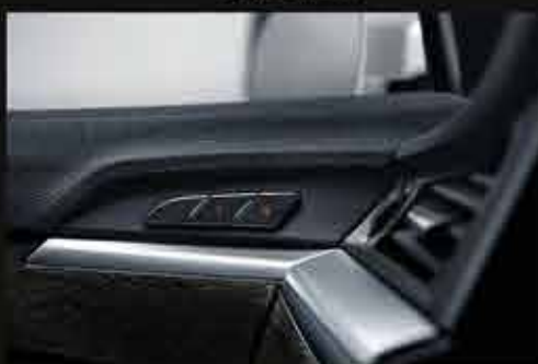
ФУНКЦИЯ ПАМЯТИ НАСТРОЕК ВОДИТЕЛЬСКОГО СИДЕНЬЯ, НАРУЖНЫХ ЗЕРКАЛ И РУЛЕВОЙ КОЛОНКИ